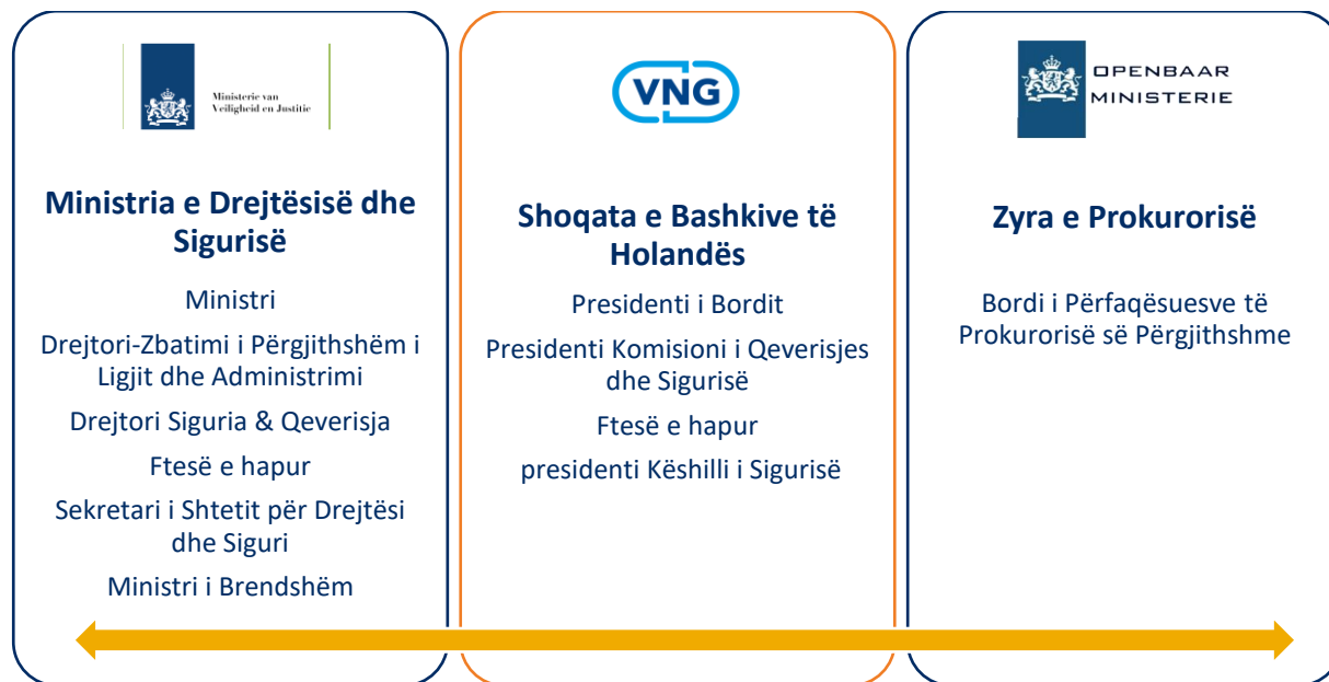
Figura 2 Hartimi i Konsultimit Strategjik të Sigurisë

Shoqata e Bashkive të Holandës (SHBH) luan rol të rëndësishëm në të dyja organet. Ajo përfaqëson interesin e gjithë 255 qeverive vendore dhe angazhon qeverinë qendrore në të gjitha aspektet e sigurisë publike në nivel vendor. Për këtë qëllim, SHBH-ja punon ngushtësisht me Konsultimin Strategjik për Sigurinë dhe Këshillin e Sigurisë. Për shembull, presidenti i SHBH-së është anëtar i delegacionit të Konsultimit Strategjik për Sigurinë. Ky bashkëpunim është i dukshëm gjithashtu në faktin se Këshilli i Sigurisë përshtat drejtimin e tij me bordin e menaxhimit të SHBH-së si edhe me Shefin e Policisë Kombëtare. Së fundi, presidenti i Këshillit të Sigurisë është nënpresident i bordit të menaxhimit të SHBH-së. 3