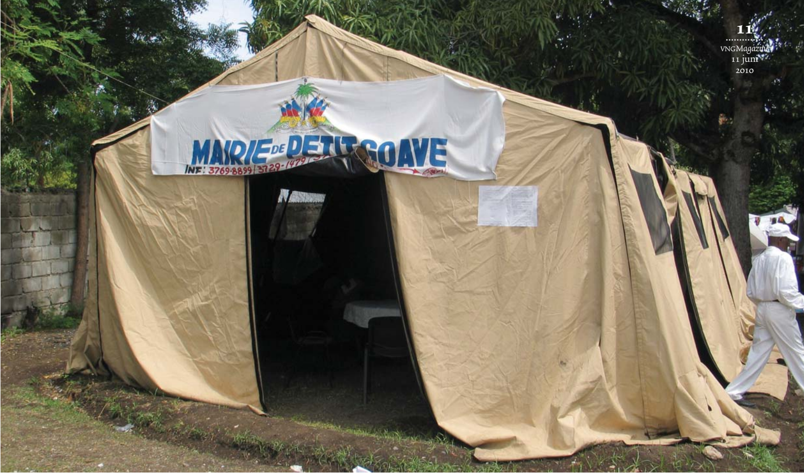
Het stadhuis van Petit-Goâve is tijdelijk in een tent gevestigd

kleine 'comité wederopbouw Haïti' met vertegenwoordigers van de gemeenten die geld stortten, naar Martinique en sprak met vele betrokkenen. Dat gaf een indruk van de behoeften. Daarna werd Haïti bezocht en viel de keuze op Les Palmes, de kuststreek ten westen van Port-au-Prince, waar vier gemeenten liggen: Petit-Goâve, Grand-Goâve, Léogane en Gressier. Samen tellen ze 400.000 inwoners. Het is het zwaarst getroffen gebied met het epicentrum van de beving.